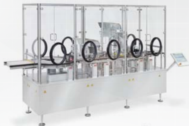
Remplisseuses de liquide et bouchonneuses