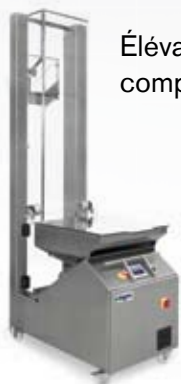
Élévateurs de comprimés