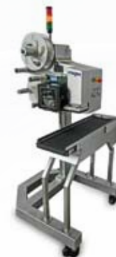
Étiqueteuses avec imprimantes et applicateurs d'étiquettes