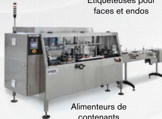
Alimenteurs de contenants