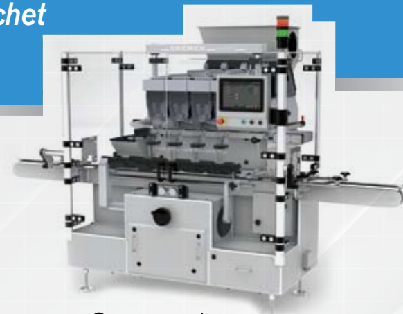
Compteurs de comprimés