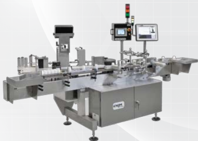
Étiqueteuses et sérialisation de flacons