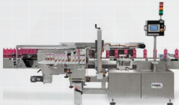
Étiqueteuses pour faces et endos