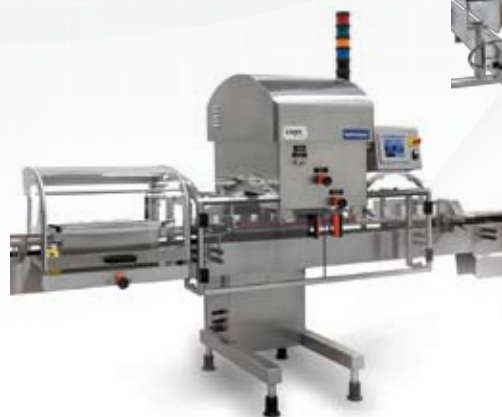
Resserreuses de bouchons